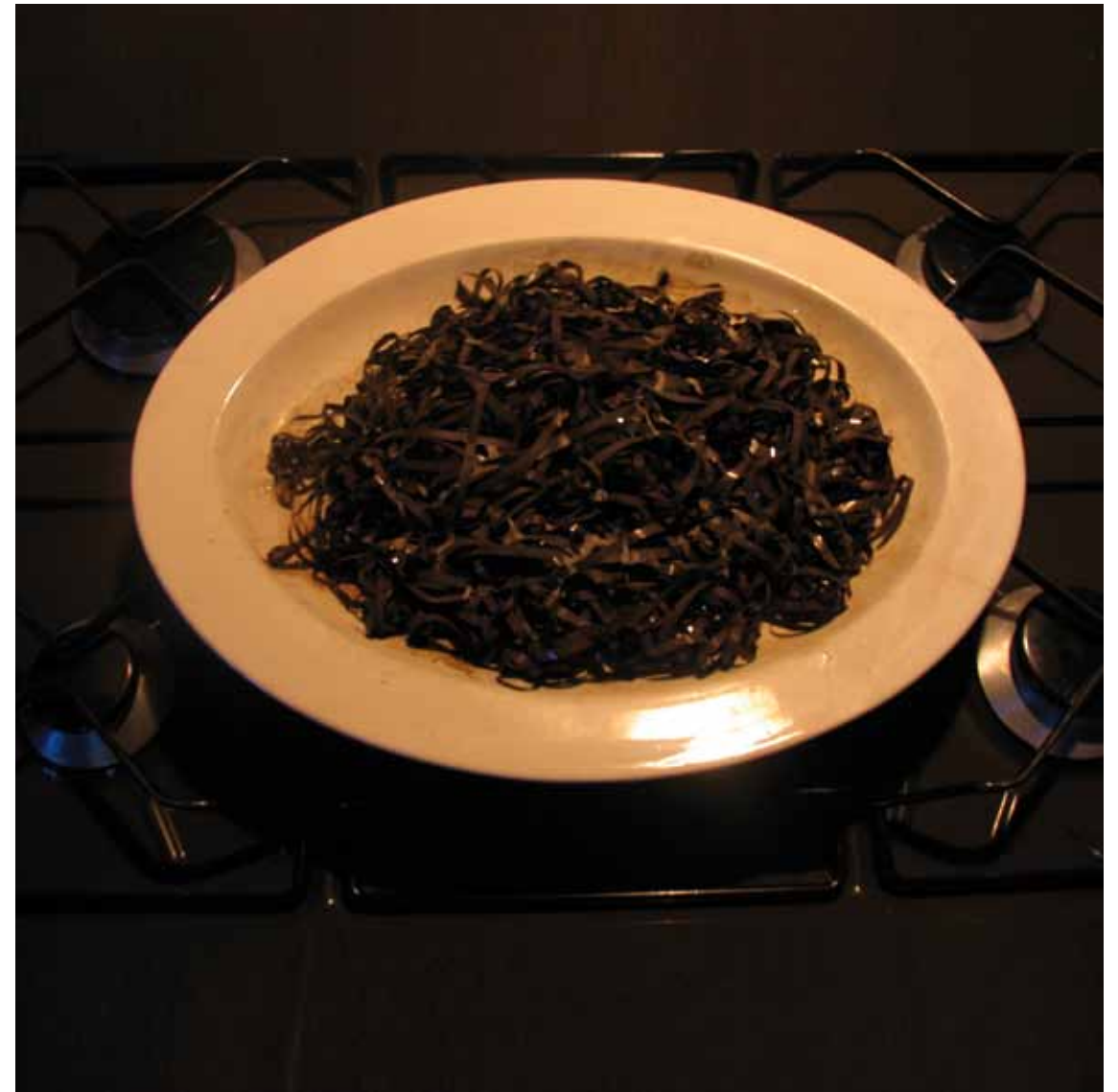
“Tagliatelle musicali” cm. 34 X 18 / 1997 photography