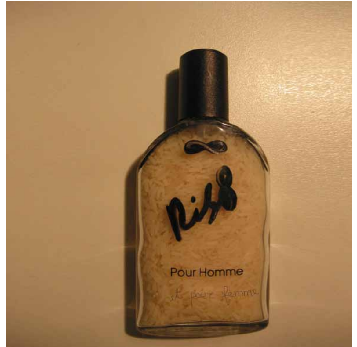
“Ris8 pour homme et pour femme” cm. 20 X 20 / 2005 photography